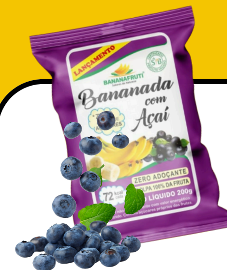
BANANADA COM AÇAÍ 200g