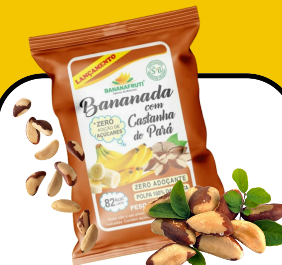
BANANADA COM CASTANHA DO PARÁ 200g