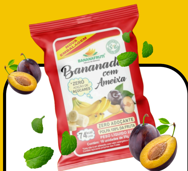
BANANADA COM AMEIXA 250g