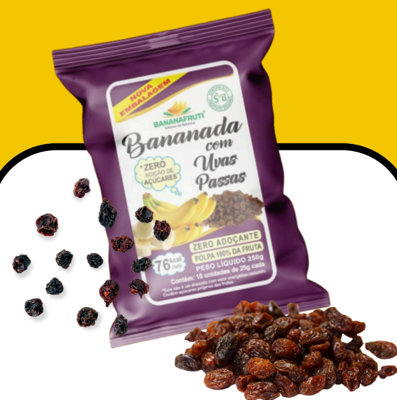
BANANADA COM UVA PASSAS 250g