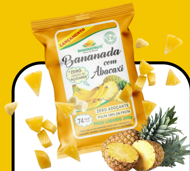
BANANADA COM ABACAXI 200g