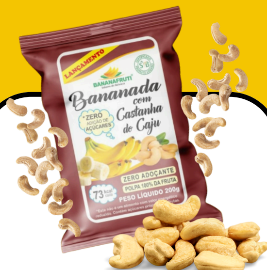
BANANADA COM CASTANHA DO CAJU 200g