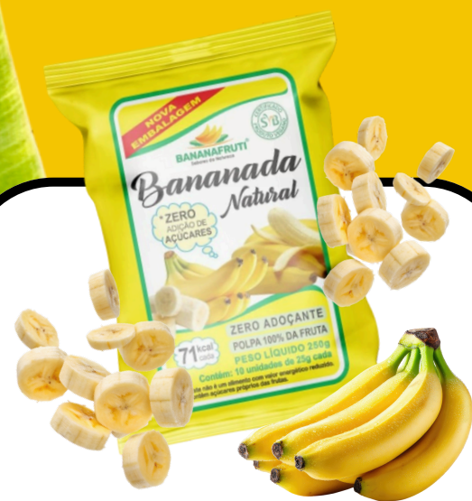
BANANADA NATURAL 250g