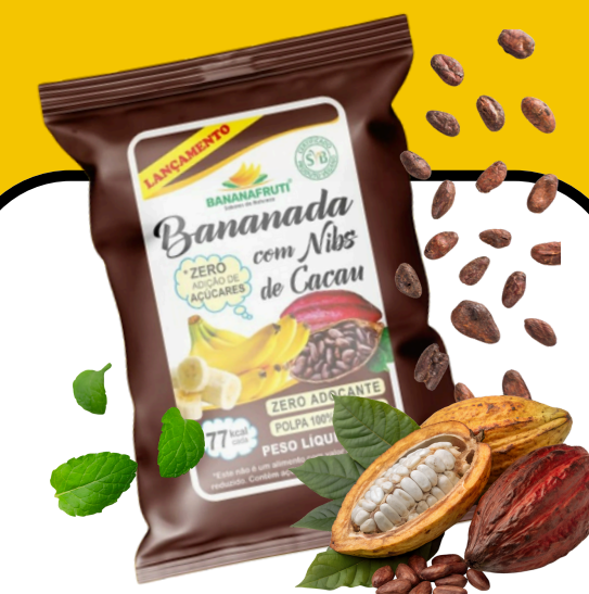
BANANADA COM NIBS DE CACAU 200g