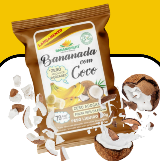
BANANADA COM COCO 200g